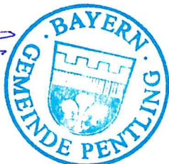
Barbara Wilhelm 1. Bürgermeisterin

ausgehängt am: 21.01.2022 abgenommen am: 28.01.2022